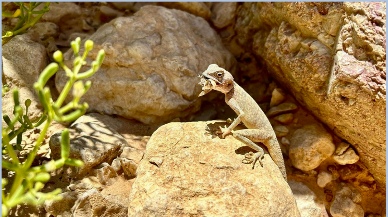
נחל נטפים הרי אילת

נשמח לקבל דיווחי תצפיות מכם- תושבי ומטיילי האיזור שלחו למייל- matbeon.boker@gmail.com